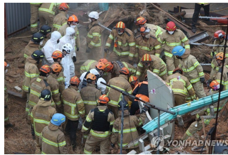
- 사고사례 분석